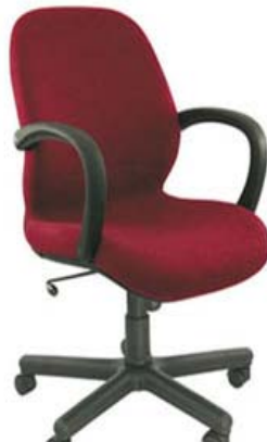
Слика: приближан изглед