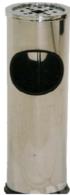
Слика: приближан изглед

Димензија 630 x 250 мм. Димензије су оквирне и дозвољења су одступања \pm 2 цм. Самостојећа метална пепељара површински обрађена прашкастом бојом. Врх и рупичаста мрежа произведени су од нерђајућег челика. Погодна за унутрашње и спољашне просторе. Задњи део пепељаре има простор за смештај за опушке. Боја: метално црвена. Гарантни рок: минимално 1 година.