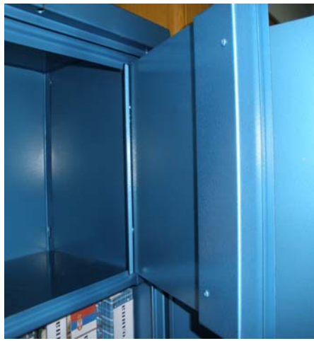
Слика: приближан изглед

Изглед ормара металног-касе се може видети у Управи за општу логистику