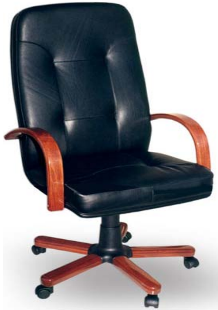
Слика: приближан изглед

боји. Полуфотеља поседује 5(пет) квалитетних точкићима који се ротирају у свим правцима. Средишњи стуб је металне конструкције обложен пластиком у коме је смештен гасни амортизер као подизач столице. Руконаслони су дрвени и лакирани. Боја: махагони. Седиште и наслон: дрвена шкољка (пресован шпер). Шкољка се облаже полиуретаном (сунђером) дебљине 7 цм и тапацира кожом црне боје. Носивости до 130 кг. Податак о носивости види се у декларацији произвођача. Димензије су оквирне и дозвољења су одступања \pm 5\% . Гарантни рок: минимално 18 месеци